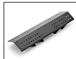
Emaillierte Flammenabdeckung mit TBS Equal Heat System (EHS)