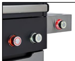
Beleuchtete LED-Bedienknöpfe mit Funktionsanzeige