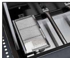
Ein innenliegender Infrarot Steakbrenner